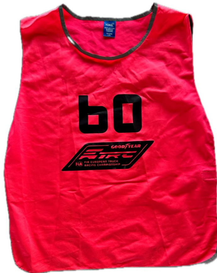
Mediálna vesta na trať